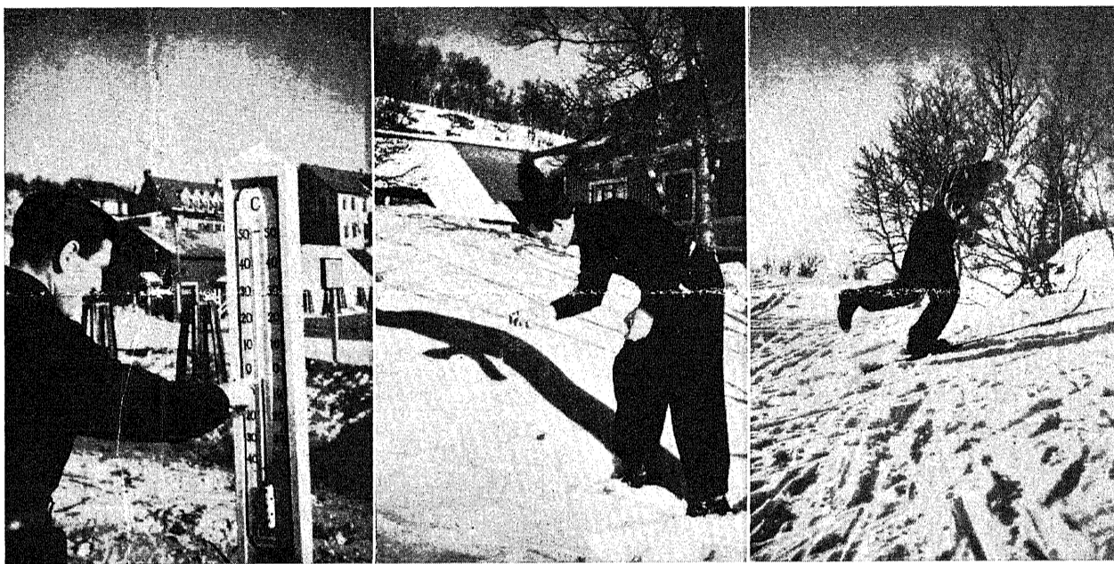
Några vallningsmoment. — Bilden t. v.: Temperaturen å rättvisande termometer avläses. — I mitten: Snöbeskaffenhetsen bör noggrant undersökas. — T. h.: Ytvallans "stigförmåga" i uppförsbackar provas (hopp på ett ben uppför!).

Ordentligt och rätt vallade skidor höja avsevärt nöjet av skidåkningen