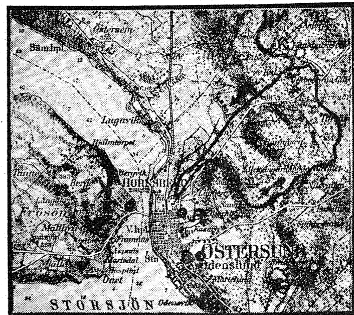
Märkesbanan å 1½ mil.

(A. visar startplatsen för ungdomens märkesbana i Östersund, B. i Odenslund och C. å Hornsberg).