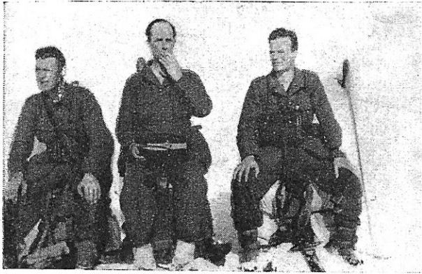
Rast vid Njeravajen (3 mil norr om Hotagen)