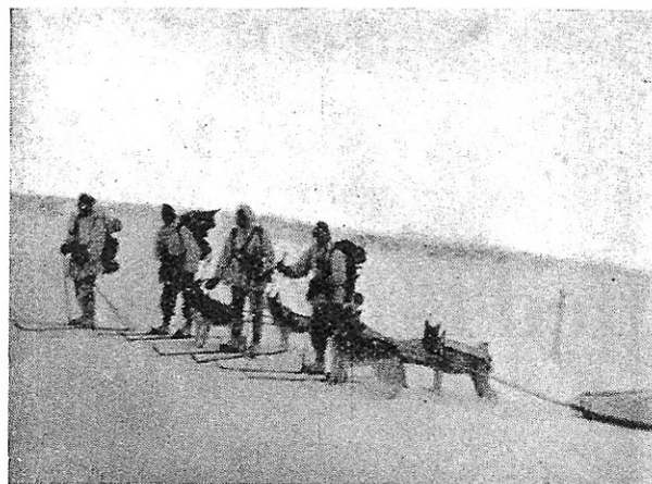
I snöstorm från Sylarna över Helags mot bivacken vid platsen för »Fältjägerstugan». Obs.! Renhjorden i bakgrunden.

länge på förrän Helagsfjället skymtade bland stormbyarna och de nu ganska nöjda turisterna gingo tacksamt in under tak.