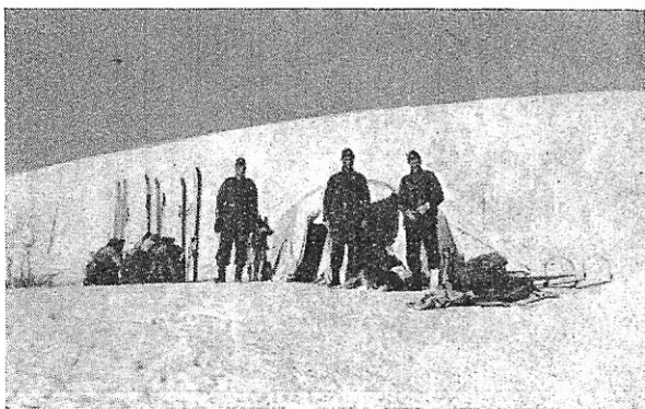
Vid bivacken norr Skelta (3 mil nordväst Kolåsen).

Det gick finfint med kaminen hemma i kasern och tältet vid Anjeskutans sluttningar! Visserligen kändes näsan både kall och våt på morgonen, men