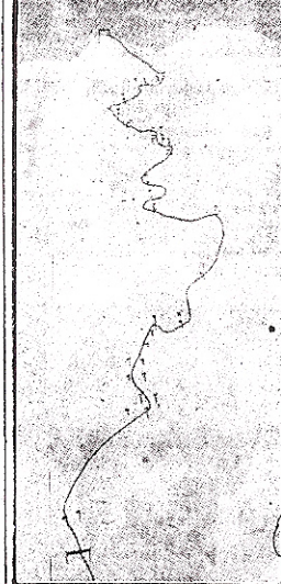
En typisk Slalom-bana.