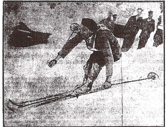
Riktig kroppsställning, skid- och stavförling i svår utförlöppning.

En norsk klubb har beslutat att i vinter arrangeras Slalom-lopp för damer. Man väntar mycket stor anslutning, och tävlingen torde bli en succé.