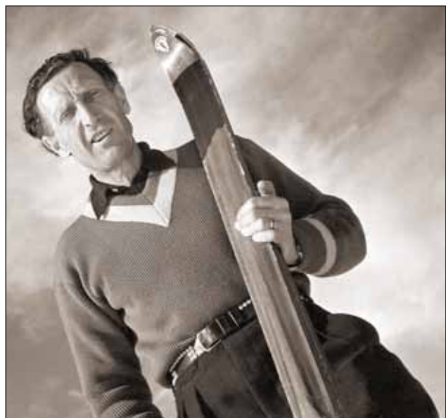
OS i St Moritz 1948. Olle är nu lagledare och tränare för det svenska alpina landslaget.